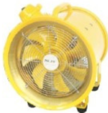
BTF-20, 25, 30