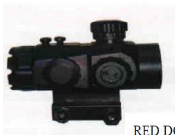
رد دات RED DOT